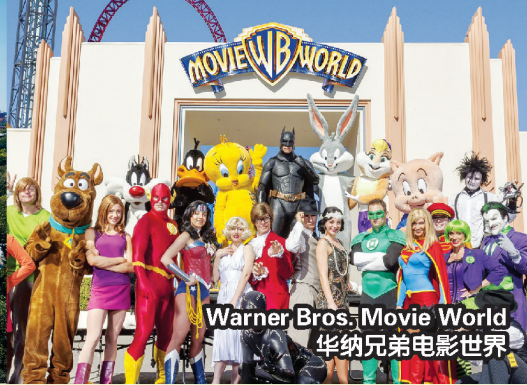
Warner Bros. Movie World 华纳兄弟电影世界