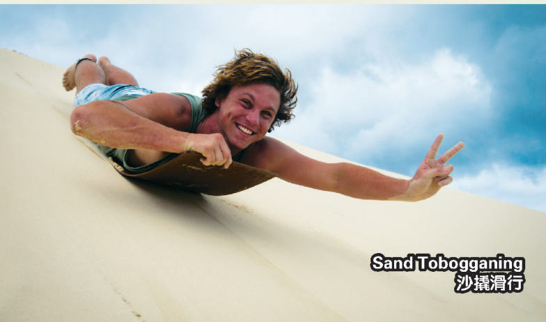
Sand Tobogganing 沙撬滑行