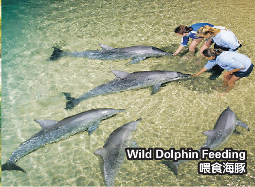
Wild Dolphin Feeding 喂食海豚