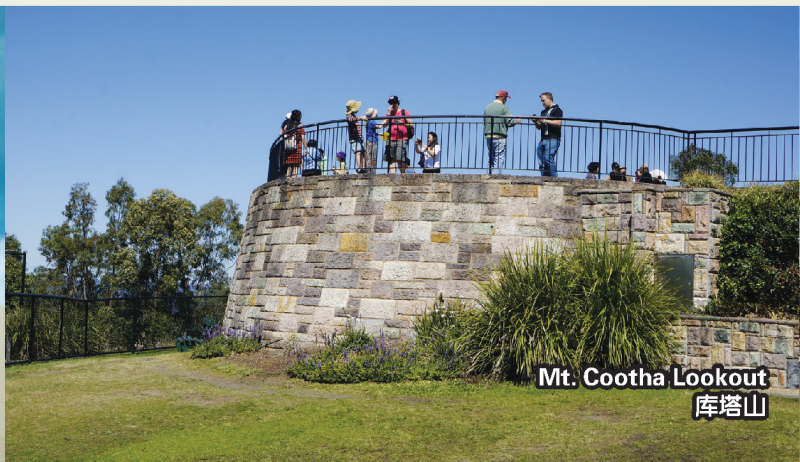
Mt. Cootha Lookout 库塔山