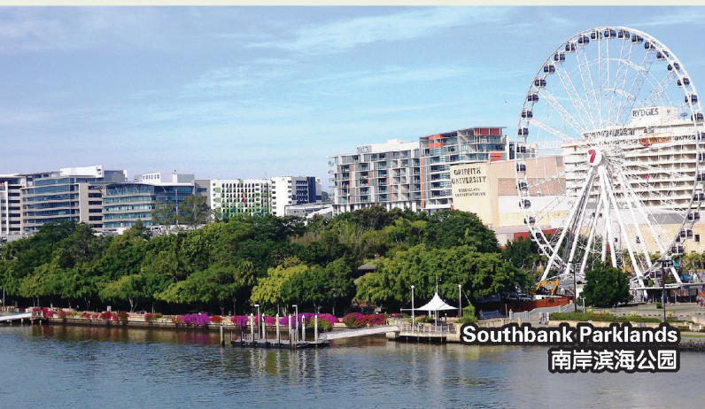
Southbank Parklands 南岸滨海公园