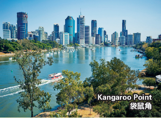
Kangaroo Point 袋鼠角