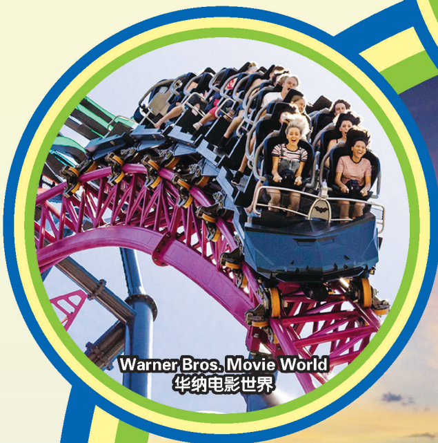
Warner Bros. Movie World 华纳电影世界