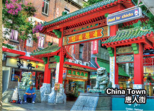
China Town 唐人街