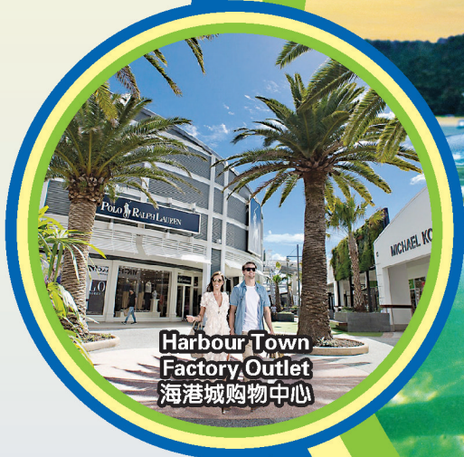
Harbour Town Factory Outlet 海港城购物中心

行程次序，以当地旅社安排为准。 Sequences of Itinerary are subject to local arrangement.