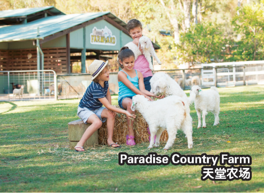
Paradise Country Farm 天堂农场