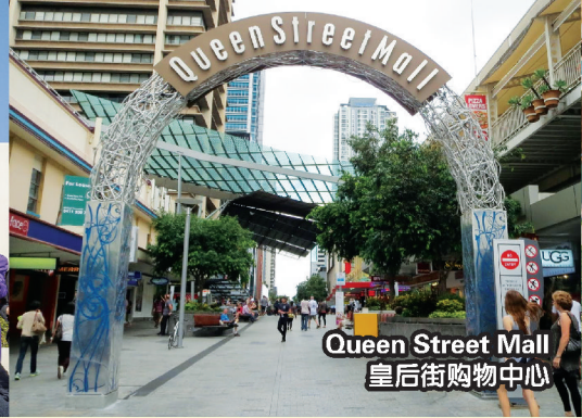
Queen Street Mall 皇后街购物中心