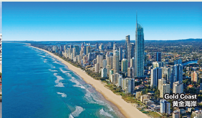
Gold Coast 黄金海岸